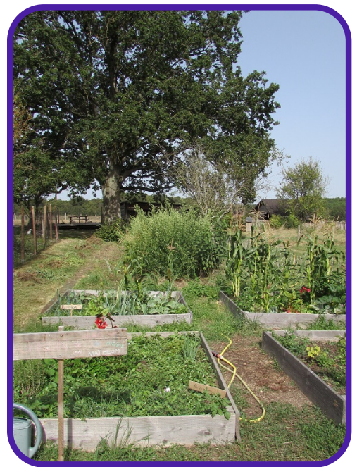
FERME DE NAT- 49490 BROCC MAINE ET LOIRE